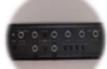
プリメインアンプ SANSUI AU-555 25,000円～