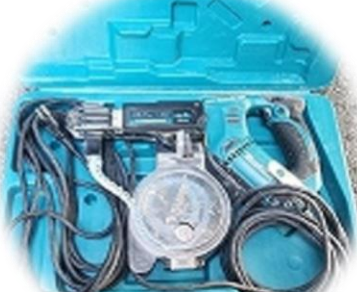
マキタ オートパック スクレイドライバー 2,000円～