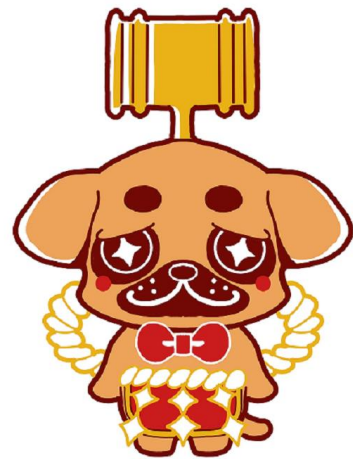
こうちこうばいふるじょく PRキャラクター公募企画 優秀作品『このすけ』