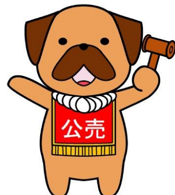
こうちこうばいふるじょく PRキャラクター公募企画 優秀作品『たかきみ(高公)くん』