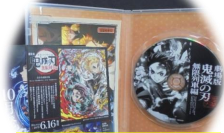
劇場版 鬼滅の刃 無限列車編 DVD 700円～