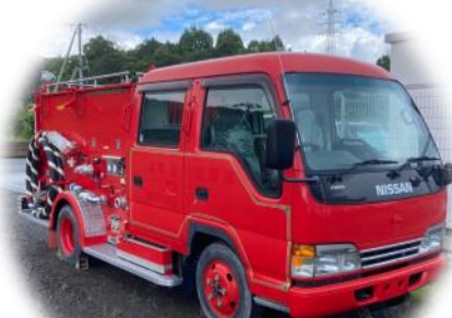
ニッサン アトラス 初年度登録H11.12 100,000円～