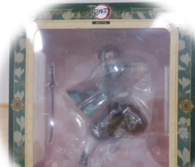
1番くじ 鬼滅の刃 竈門 炭治郎 フィギュア 1,000円～