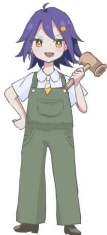
こうちこうばいふるじょく PRキャラクター公募企画 優秀作品『なすかわ あき』