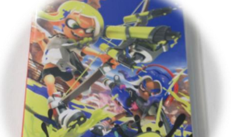
Nintendo Switchソフト スプラトゥーン3 2,500円～