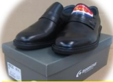
ビジネスシューズ 27.0cm MOONSTAR MB6020 5,000円～