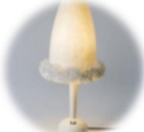
土佐和紙照明器具 tutu 小テーブルスタンド 13,000円～